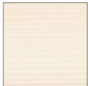
7393 Белый прозрачный