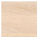
3066 Белый прозрачный