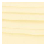
3009 Бесцветный полуматовый с антискользящим эффектом (R9)